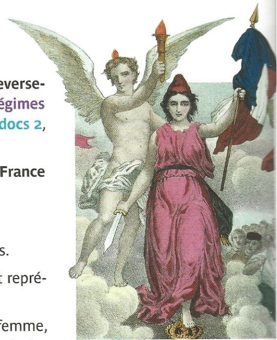
Doc. 9 Le triomphe de la République

Anonyme, lithographie, colorié, hauteur : 46 cm, largeur : 30,3 cm (détail). Musée Carnavalet, Paris.